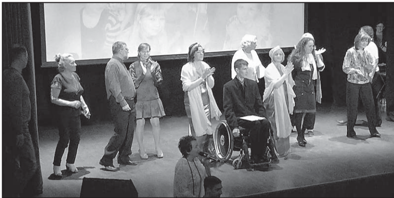
На празднике, посвященном 10-летию Центра, в КДЦ «Галактика»