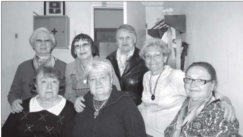
Члены правления Приморской МО СПб ГО ООО «ВОИ».

Что удалось сделать? Отдел спорта выделил нам 32 абонента в бассейн, многие занимаются скандинавской ходьбой, организованной муниципалитетами. Желающие участвуют в зимних спортивных праздниках в спорткомплексе Газпром, на ул. Планерной. Некоторые любители физкультуры даже занимаются китайской оздоровительной гимнастикой, на Шаврова д.4. Заключение договора (с 14-ю театрами) на посещение спектаклей по льготной цене. Муниципалитеты Юнтолово, Коломаги, и округ № 65 традиционно организуют экскурсии по дворцам Петербурга и историческим достопримечательностям пригородов. Многие члены ВОИ впервые воочию смогли познакомиться с архитектурными жемчужинами XIX века. Особенно всем запомнились поездки в Тихвин и Свирский монастырь. Удивление и восторг вызвали у людей такие экскурсии, как «Кронштадт», «Храмы Карелии», «Царское Село», «Ломоносов»; интерьеры петербургских дворцов – Строгановского, Шереметьевского и Юсуповского – поражали богатством, величием и красотой! Прогулки по рекам и каналам Петербурга были очень-очень познавательны и оставили неизгладимые впечатления!