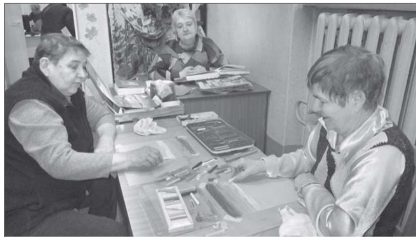
Занятия по рисованию пастелью.

Члены нашей организации с удовольствием посещают кружки декоративно-прикладного творчества в социальном доме (ул. Шаврова, 4) и в Доме ветеранов (ул. Новикова, 4). Кроме того, они охотно участвуют в праздни-