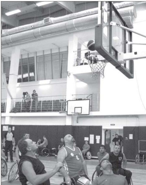
Опасный момент у кольца команды «Turkish Wolves».

– Команда перемещается по России в основном на самолёте, и в Петербург мы прибыли самолётом. Благодаря Паралимпийским играм в Сочи, сейчас службы в аэропортах работают на хоро-