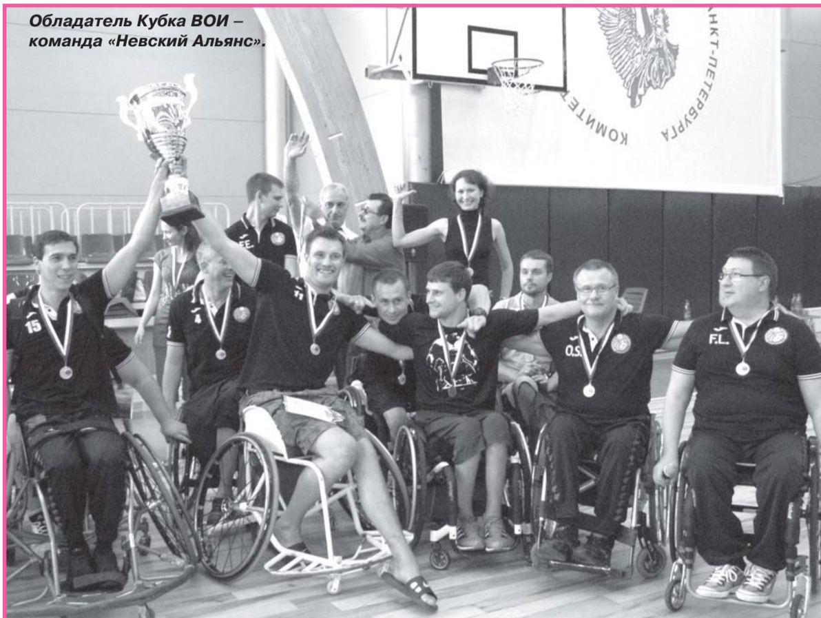
Обладатель Кубка ВОИ – команда «Невский Альянс».

Необычно жаркий август выдался в Петербурге в этом году, жарко было и на спортивной площадке Физкультурно-оздоровительного комплекса на проспекте Испытателей, д.2, к.3 СПб ГАУ «Дирекция по управлению спортивными сооружениями» – настолько острым был накал борьбы между участниками Открытого турнира по баскетболу на колясках «Кубок ВОИ»! Турнир проходил с 22 по 25 августа. Организаторы постарались сделать так, чтобы ни участникам соревнований, ни болельщикам не было скучно: 7 команд играли каждая с каждой по кругу, и потом по результатам всех встреч был определен победитель и последующее распределение мест между командами.