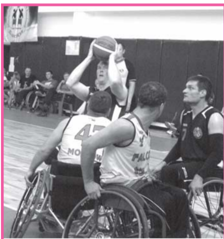
Игроки «Невского Альянса» атакуют кольцо московской команды «Фалькон».

Но хорошо нам было в Петербурге не только по причине необыкновенно теплой погоды, но и потому что нас окружали хорошие люди. К примеру, когда петербуржцы узнали, что по какому-то недоразумению у нашей команды потерялась значительная часть спортивных колясок, они всячески старались нам по-