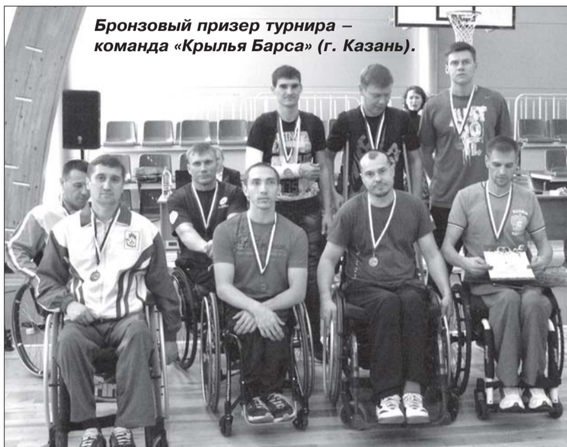
Бронзовый призер турнира – команда «Крылья Барса» (г. Казань).