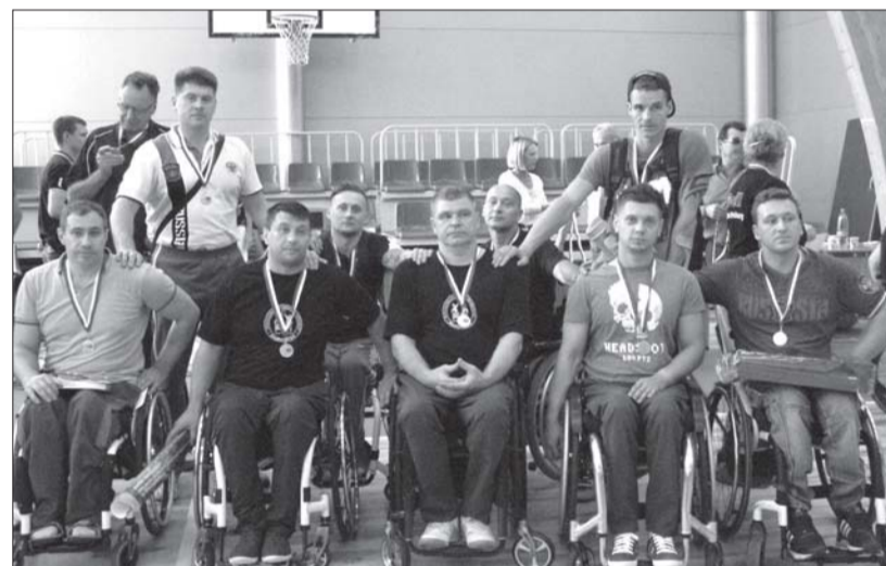
Серебряный призер турнира – ФСКИ «БасКИ» – «Невские звёзды» (г. Санкт-Петербург).

энергичной игры в защите. Для этого нужны определённые навыки, которые не у всех наших спортсменов есть. С другой стороны, это первый турнир сезона, подготовка к которому у нас была не очень «длинной». Тем не менее наша основная тактика (активная защита и быстрый переход в атаку) остается на весь сезон.