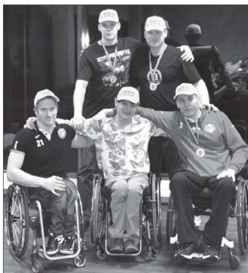
Символическая пятерка турнира Кубок Цесиса.

– Я планирую, что будут участвовать 7 команд – сильнейшие