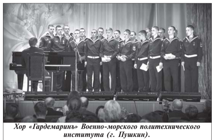
Хор «Гардемаринь» Военно-морского политехнического института (г. Пушкин).