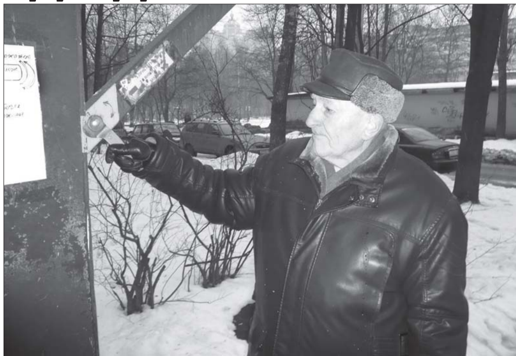
С помощью нехитрого приспособления – эксцентрика и рычага открытая дверь легко фиксируется и проход (проезд) в подъезд свободен.

– ул. Демьяна Бедного, 8; ул. Руднева, 13, пр. Луначарского, дома 58-3 и 21-3; Суздальский пр., 9. Теперь по существу Вашего вопроса, что мною движет. Знаете, ещё в детстве я поклялся, что никогда не буду бродяжничать, не буду курить, обогащаться, а буду созидать и жить за счёт исключительно своего труда. Я вообще считаю, что человек должен помогать по мере сил слабым. Если Бог наделил тебя каким-то талантом, например, способностью к изобретательству, ты просто обязан помочь тем, кому это качество не свойственно. В этой связи хочется вспомнить слова великой Елены Образцовой, с которой мы недавно простились: «Главное в жизни – это любовь человека к человеку,