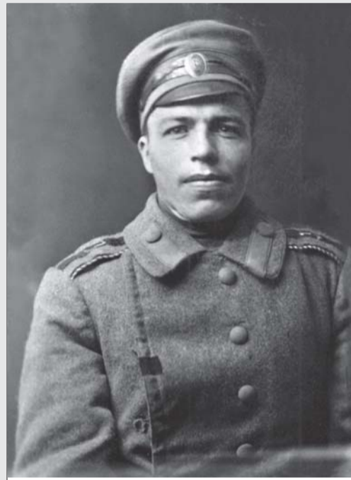
1914 г., перед отправкой на Западный фронт.

И стория говорит о том, что поводом для начала мировой войны может быть лишь одна искра. В 1914 году такой искрой стали роковые выстрелы, которые совершил утром 28 июня, вблизи набережной реки Миляцка, в центре Боснии – Сараево, сербский террорист Гаврила Принцип – член националистической организации «Млада Босна». Выстрелы сразили австро-венгерского наследника эрцгерцога Франца Фердинанда и его жену. «Теперь или никогда», – так лаконично оценил положение Вильгельм II, требуя, чтобы австро-венгерское правительство использовало сараевское убийство как повод для объявления войны. Предпосылки же войны были более серьёзные. То есть история учит тому, насколько хрупок наш мир, и как бережно люди должны относиться к нему!