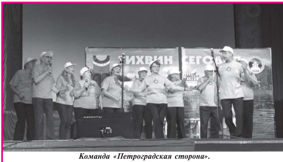
Команда «Петроградская сторона».