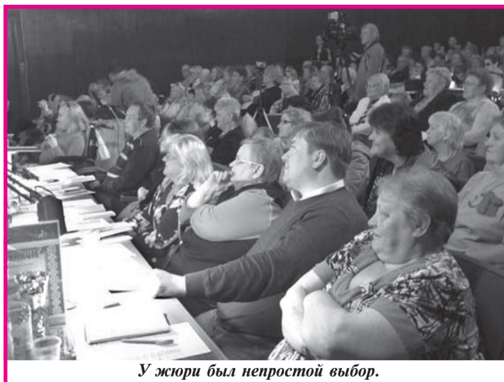
У жюри был непростой выбор.