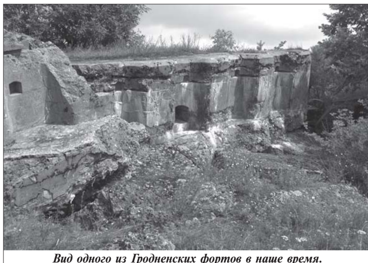
Вид одного из Гродненских фортов в наше время.