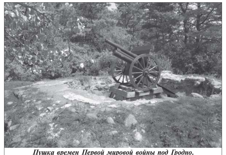
Пушка времен Первой мировой войны под Гродно.