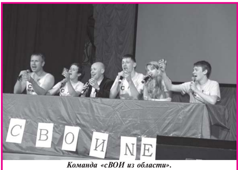
Команда «сВОИ из области».