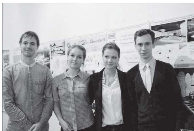
Студенты СПбГАСУ – победители Общероссийского конкурса студенческих работ в области универсального дизайна и создания безбарьерной городской среды для маломобильных групп населения.

– Рекомендовать правлению Всероссийского общества инвалидов организовать координацию и методическую поддержку работе региональных организаций ВОИ по созданию учебно-методических